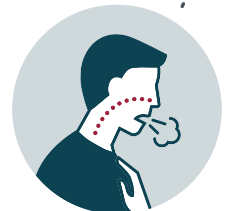
Sensación de falta de aire